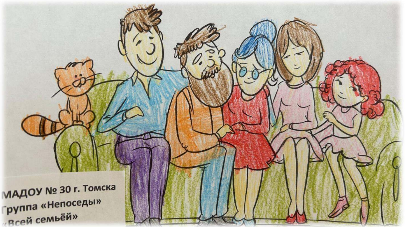
МАДОУ № 30 г. Томска Группа «Непоседы» «Всей семьёй»