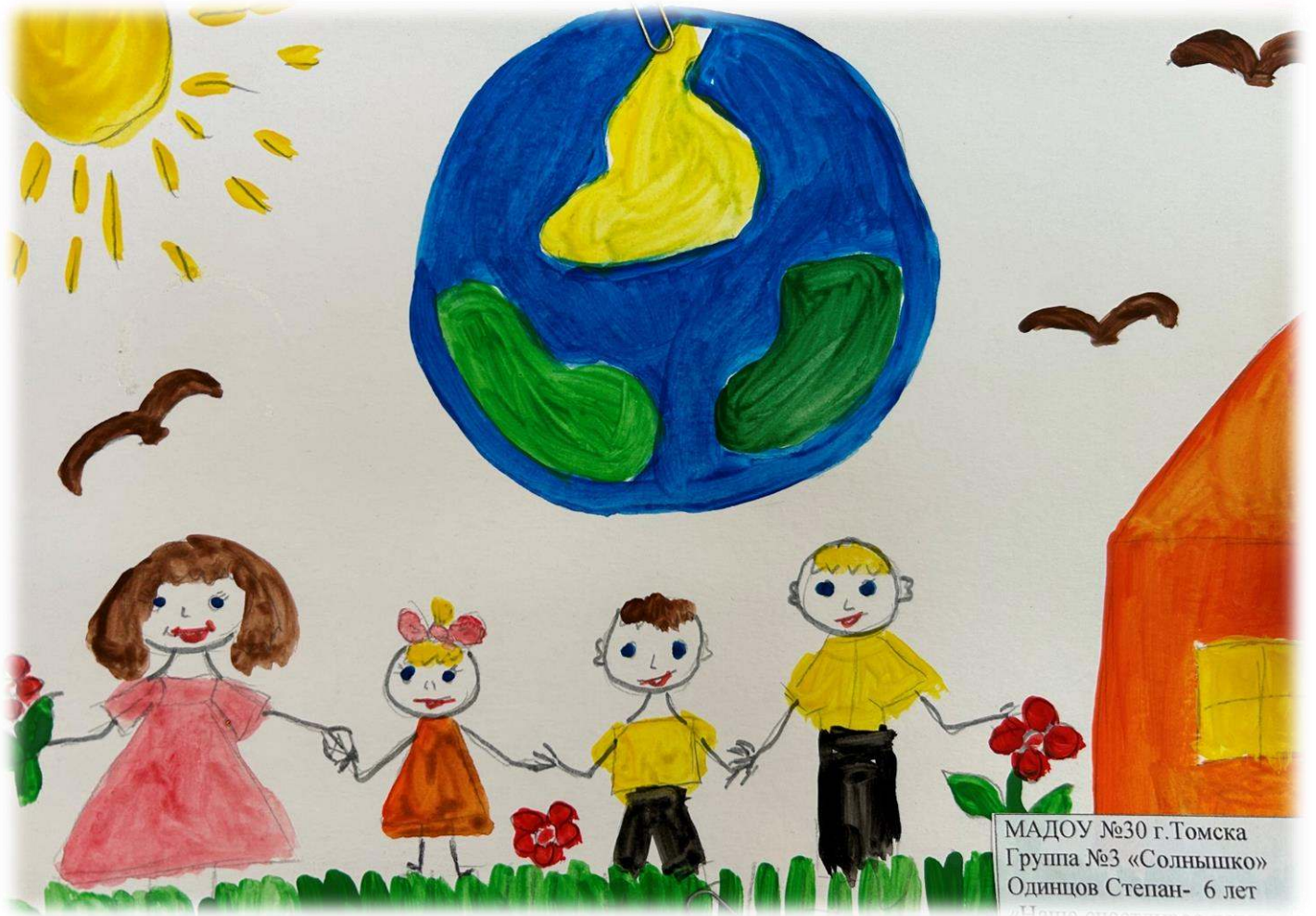
МАДОУ №30 г.Томска Группа №3 «Солнышко» Одинцов Степан- 6 лет «Наша планета»