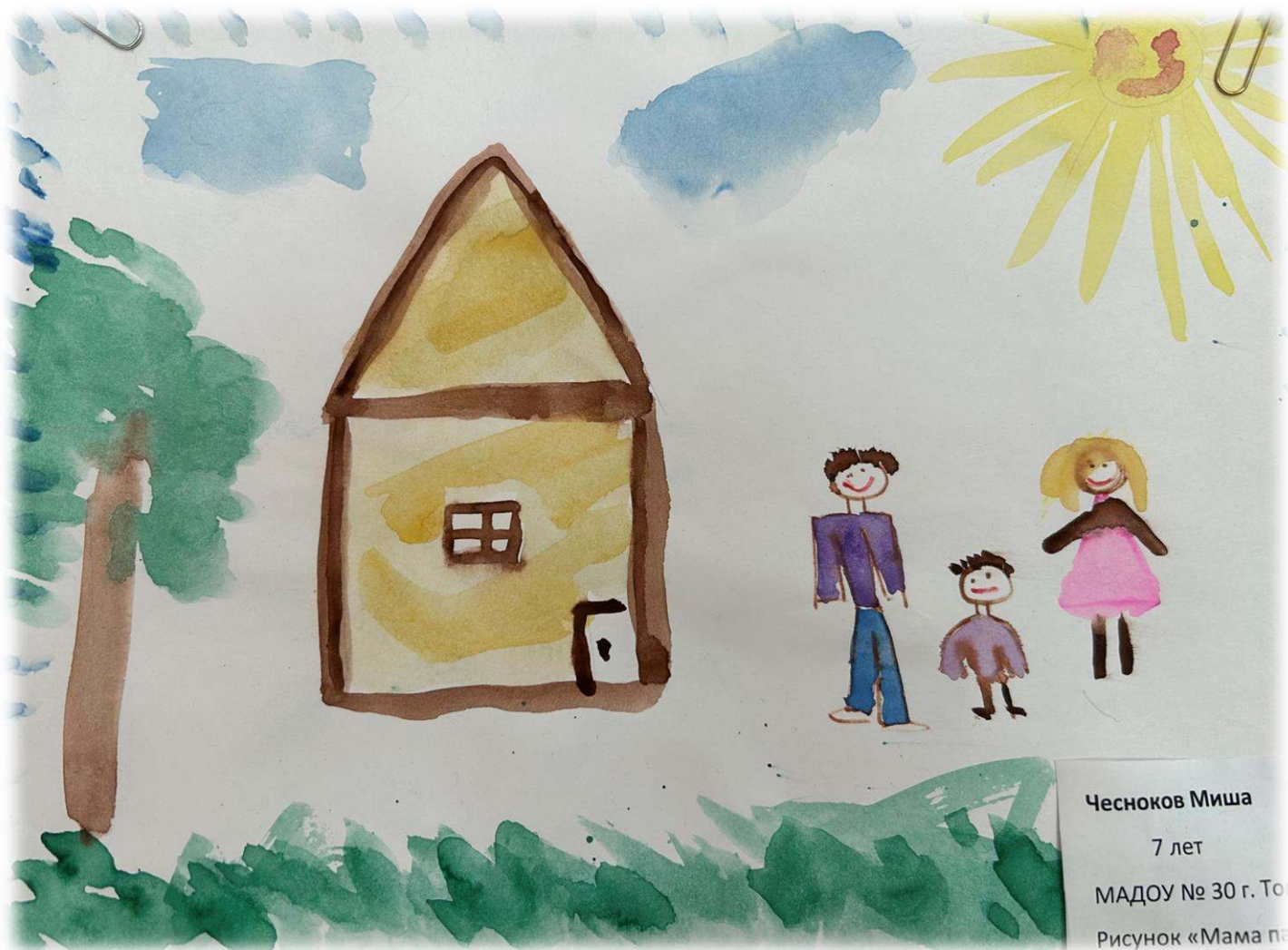
Чесноков Миша 7 лет МАДОУ № 30 г. То Рисунок «Мама па