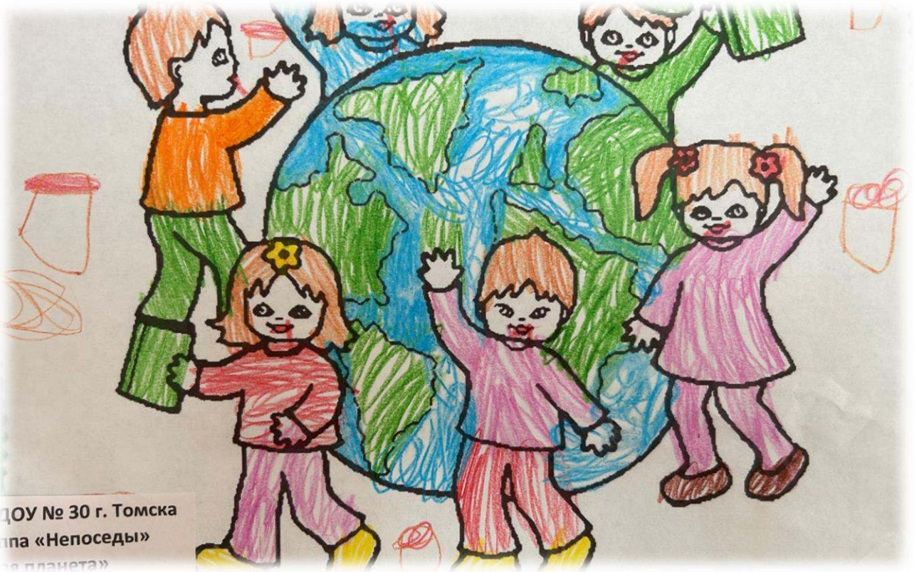
ДОУ № 30 г. Томска Группа «Непоседы» «Наша планета»